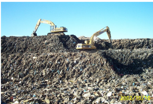
Rückbau und Umlagerung